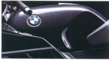
K 1 K 100 RS K 75 RT K 75 S K 75 670 classicsschwarz-metallic