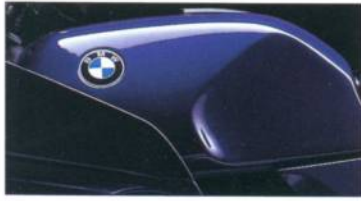
K 1 K 100 RS K 75 RT K 75 S K 75 680 königsblau-metallic