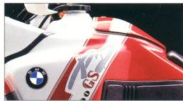
R 100 GS PD 659 alpinweiß /marakeschrot