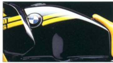
R 100 GS R 80 GS 640 avusschwarz / gelb