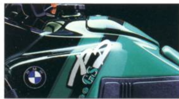
R 100 GS PD 672 flashgrün /avusschwarz