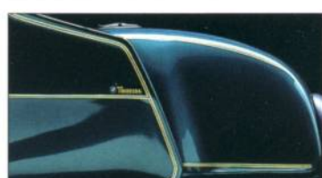
R 100 RT 684 piniengrün-metallic