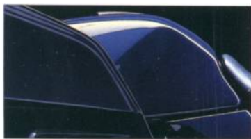
K 1100 LT 681 königsblau-metallic