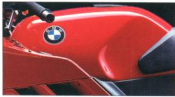
K 1 658 marakeschrot