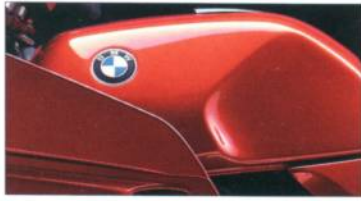
K 100 RS K 75 RT K 75 S K 75 675 rotmetallic