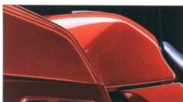
K 1100 LT 682 rotmetallic