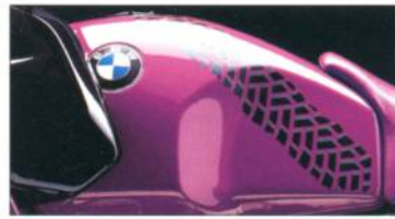
R 100 GS R 80 GS 671 caricablau /avusschwarz