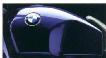
R 100 R 685 amethyst-metallic