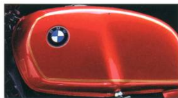
R 100 RT R 80 RT R 80 R 65 654 rotmetallic