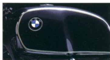
R 100 R R 100 RT R 80 RT R 80 R 65 656 classicsschwarz-metallic