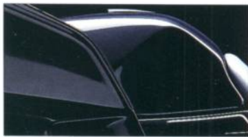
K 1100 LT 679 classicsschwarz-metallic