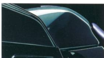
K 1100 LT 683 piniengrün-metallic