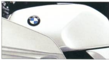
K 100 RS 678 perlsilber-metallic