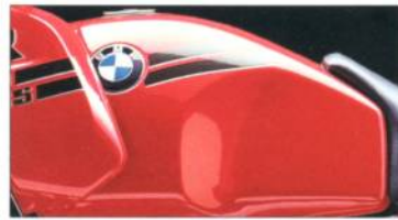
R 100 GS R 80 GS 641 marakeschrot