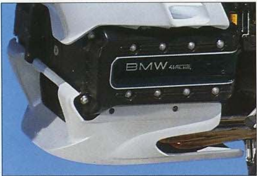
Der BMW Motorspoiler für die K100RS ist aerodynamisch optimal auf die Maschine abgestimmt. Das Ergebnis: bessere Bodenhaftung, vor allem bei hohen Geschwindigkeiten, besserer CW-Wert und dadurch sinkender Kraftstoffverbrauch. Als Sonderausstattung erhältlich.